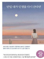
- 만일 내가 인생을 다시 산다면 - 김혜남 지음