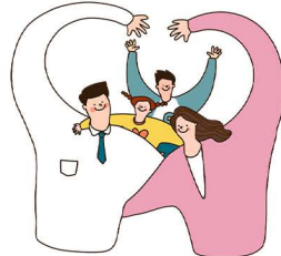
조영, 조문선목사 범사감사 (Thanksgiving)