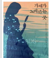
- 가재가 노래하는 곳 - 델리아 오언스 지음