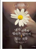
- 내가 나에게 절대로 말하지 않는 것들 - 셀레스트 응 지음